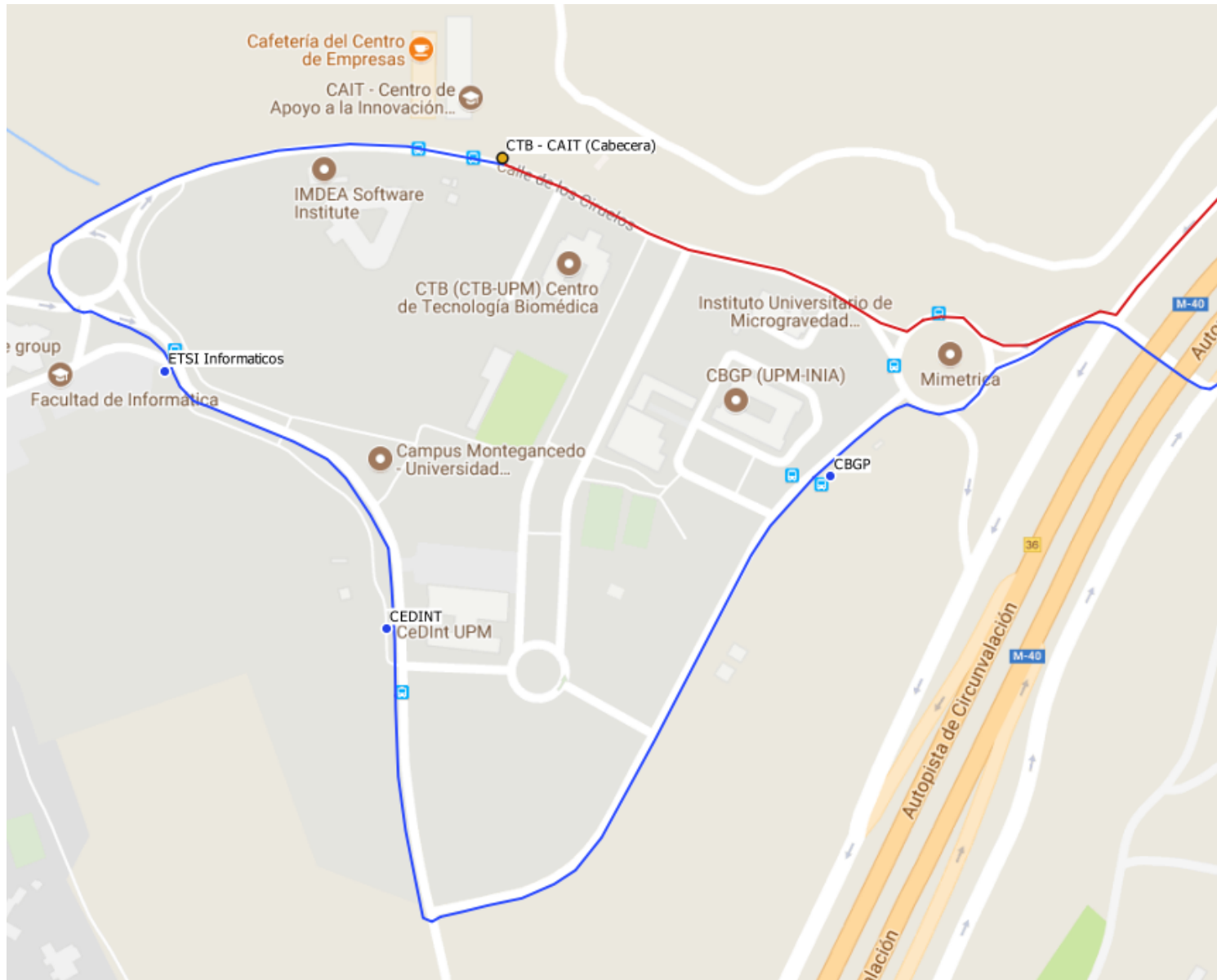
Lanzadera UPM a Montegancedo. Octubre de 2020.