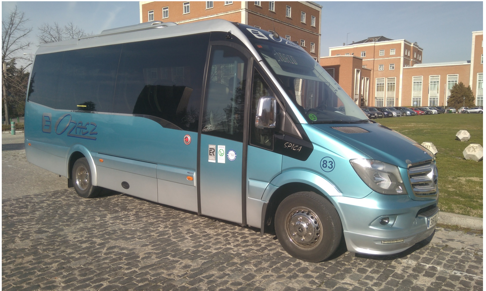
Lanzadera UPM a Montegancedo. Octubre de 2020.